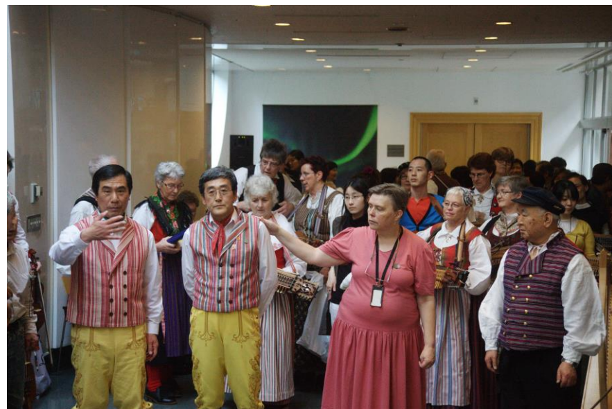
A fantastic day at the Embassy of Sweden in Tokyo with many joyful meetings in music and dancing ...